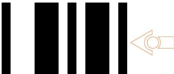
Kalibrering af infrarød sensor