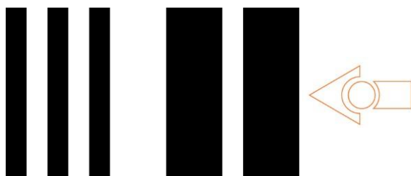
TV/DVD remote control code # 6