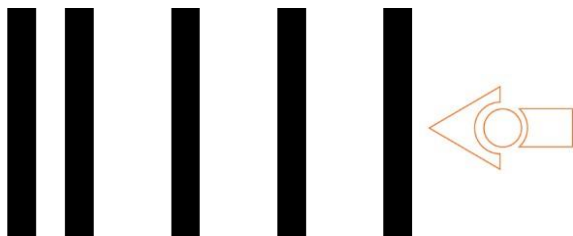
Kalibrering af kørsel (kun version 2)