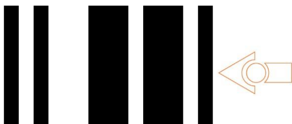
Bliv inden for stregen