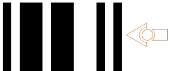
TV/DVD remote control code # 5