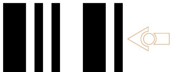
TV/DVD remote control code # 7