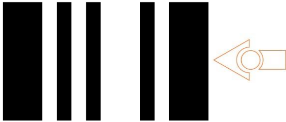
TV/DVD remote control code # 0

Fjernstyring af Edison – strekkoder der kan programmeres