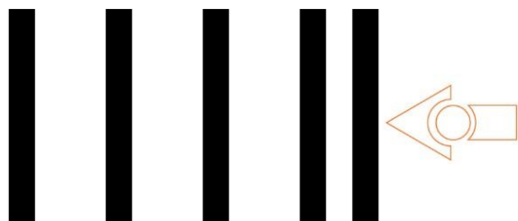
Start ved klap